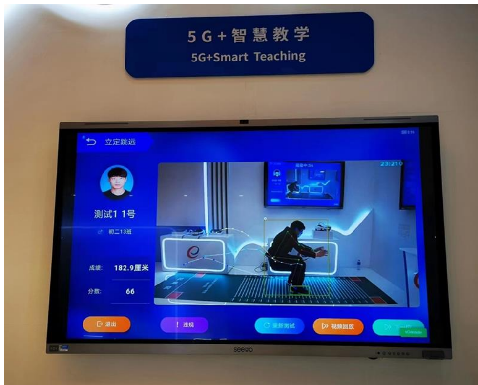
5G 智慧体育捕捉学习者动态

依托 5G 低时延、高速率、广覆盖的特性，5G 智慧体育可实时捕捉学生体育动作，无需教师亲身指导，学习者只需自主完成教学动作，AI 大数据就能实时分析生成报告和改进建议，实现个性化因材施教，相关应用已经服务超万所学校。