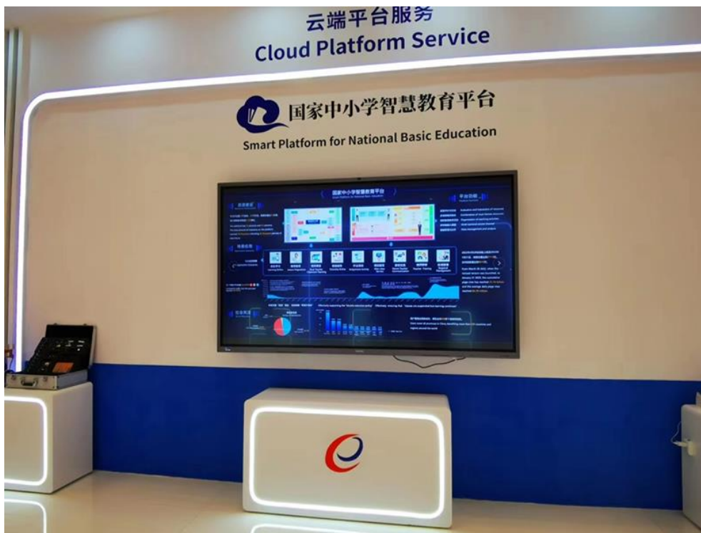
国家中小学智慧教育平台

党的二十大报告指出：“推进教育数字化，建设全民终身学习的学习型社会、学习型大国。”一系列数字化装备和平台的研发与应用，助力学科教育和素质教育的创新性变革，丰富了教学场景和教学手段，塑造了教育教学评价的新模式，为课堂插上了想象的翅膀，也为教育普惠均衡贡献数字科技的力量。数字技术不断与教育教学深度融合，不断汇聚的优质教育资源，不断提升的教书育人效率，必将为中国教育高质量发展拓宽路径，让教育变革更加惠及万千学子，成就其广阔人生和美好未来。