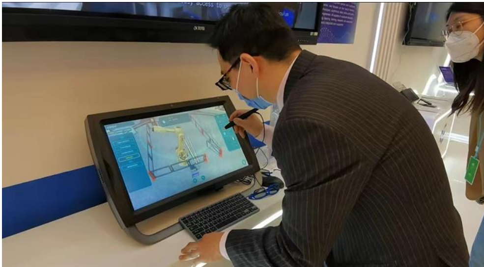
现场工作人员正在演示“虚仿一体机”

展厅另一侧，十几秒的时间内，智能评卷分析系统就快速完成了作文试卷的评测，从主题、语言、篇章结构等多方面考核了作文质量，并生成了个性化批改评语，构建了答题者知识图谱。