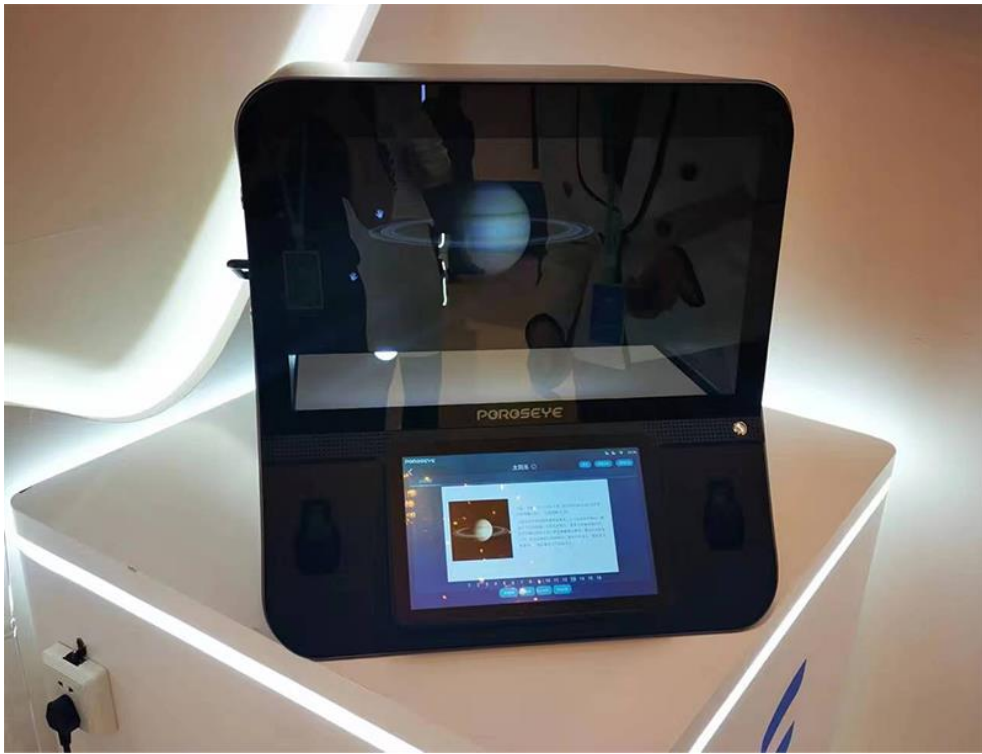
3D 实验模拟舱展示课程内容

另外，展览现场还充分展示了多项具有前瞻性、时代性、创新性的数字化教学装备和应用解决方案，体现了我国数字化教育装备应用的先进水平、引领地位和未来趋势。