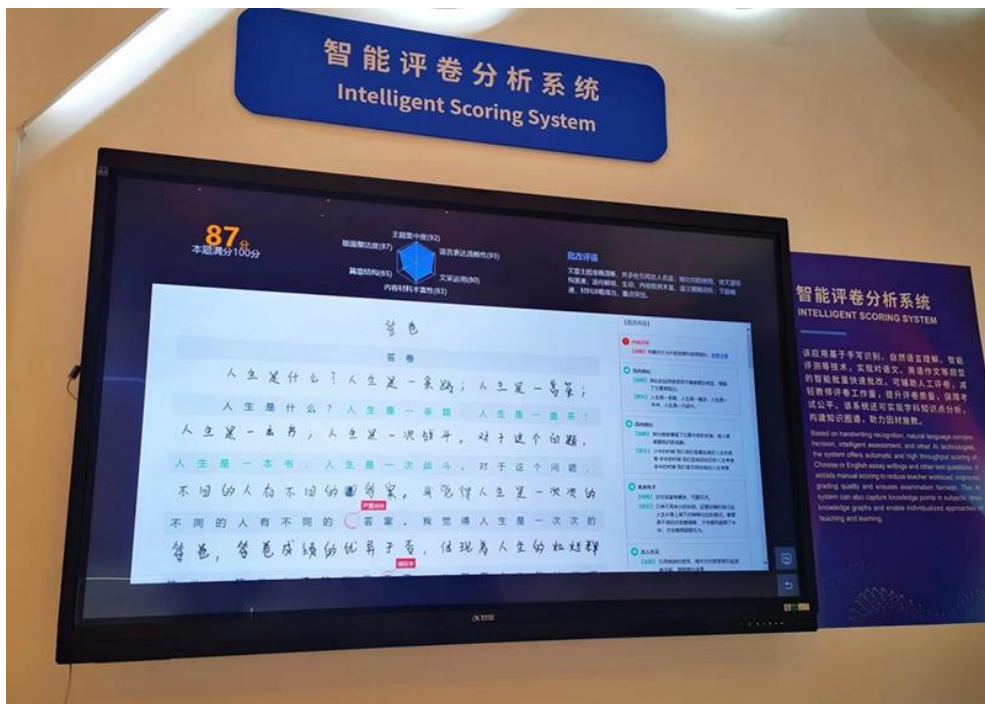
智能评卷分析系统评测学生作文

展厅另一侧，十几秒的时间内，智能评卷分析系统就快速完成了作文试卷的评测，从主题、语言、篇章结构等多方面考核了作文质量，并生成了个性化批改评语，构建了答题者知识图谱。