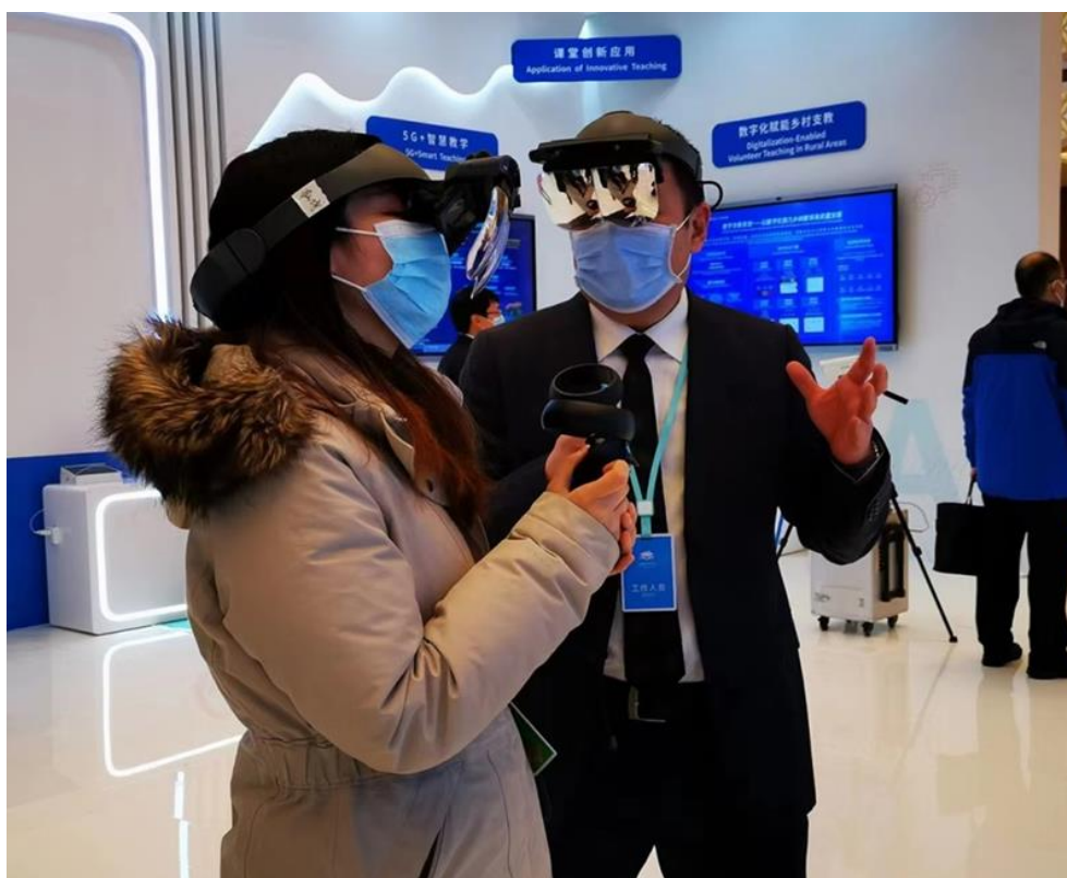
一名与会媒体记者（左）在体验混合现实头盔

在数字化教育装备应用展示区，戴上智能头盔或眼镜，操作手柄，就可以灵活拆取、检测复杂的机器零部件，利用混合现实头盔和虚仿一体机，学习者轻松地将实验实训课堂“搬”到了现场。